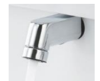
ソフト(泡まつ)吐水