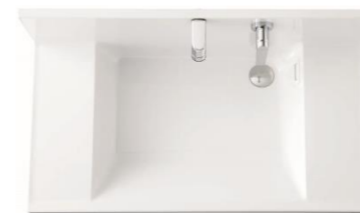
洗面ボウル(実容量約17L)