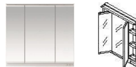
三面鏡(LED照明)(間口750mm)エコミラー仕様