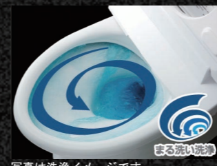
写真は洗浄イメージです。