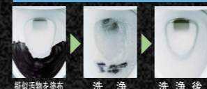
類似汚物を塗布 洗浄 洗浄後